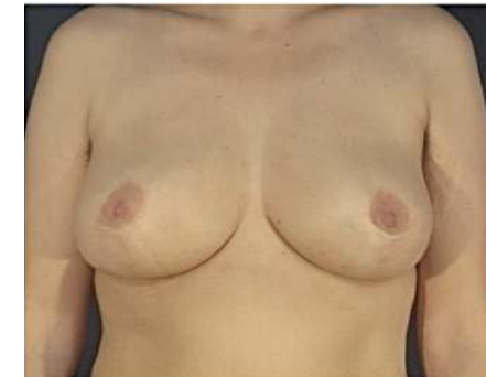
Beispielfoto Pat. B

Die Narben sind nach einem Jahr in der Regel nur noch als feine, helle Linie zu erkennen.