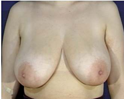
Beispielfoto Pat. A

Die Brustentwicklung ist genetisch vorgegeben und kann nicht weiter beeinflusst werden. Bei einigen Frauen entwickelt sich die Brust schon mit jungen Jahren sehr stark, bei anderen bildet sich eine so genannte »Stillbrust« nicht zurück.