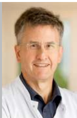
Dr. med. Klaus Ueberreiter Facharzt für plastische, ästhetische und rekonstruktive Chirurgie

Gerne können Sie eine Beruhigungstablette von uns erhalten. Sie nimmt Ihnen Nervosität und Aufregung und sorgt dafür, dass Sie den Eingriff im Halbschlaf erleben. Für die örtliche Betäubung erhalten Sie an den Lidern mit einer winzigen Kanüle je einen Einstich, den Sie kaum spüren werden. Wollen Sie von der Operation jedoch gar nichts mitbekommen, so können Sie auch in Vollnarkose operiert werden. Dafür müssen spätestens am Vortag Ihres Termins die notwendigen Untersuchungen durchgeführt und die Narkose mit dem Anästhesisten besprochen werden. In der Regel wird der Eingriff ambulant durchgeführt, so dass Sie die Klinik bereits nach wenigen Stunden wieder verlassen können.